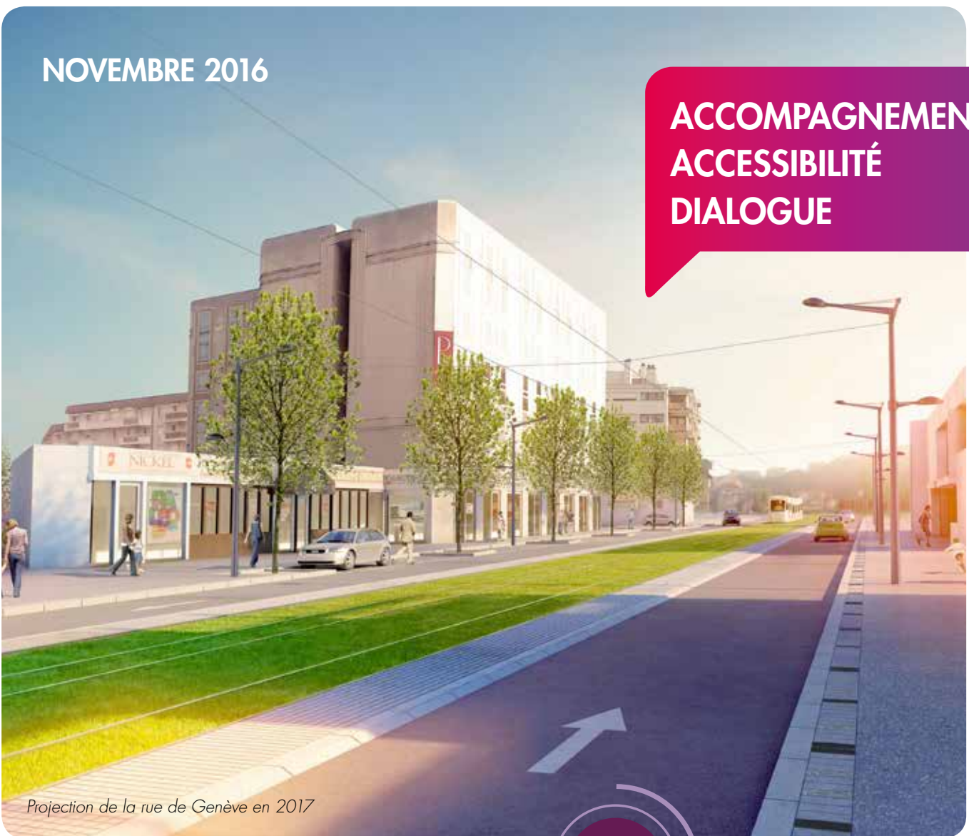
Projection de la rue de Genève en 2017