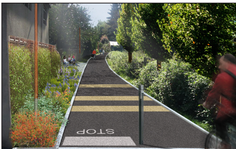
Vue 3D de la voie verte